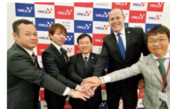
大阪日日新聞 2018年10月30日掲載

もちろん日本の国公立大学や難関私立大学への進学をサポートするための受験指導も行います。生徒さんや保護者の方々の中には「数学や理科の授業を英語で行うことで学力が低下するのではないか」と心配される方もいらっしゃいますが、各教科とも外国人教員と