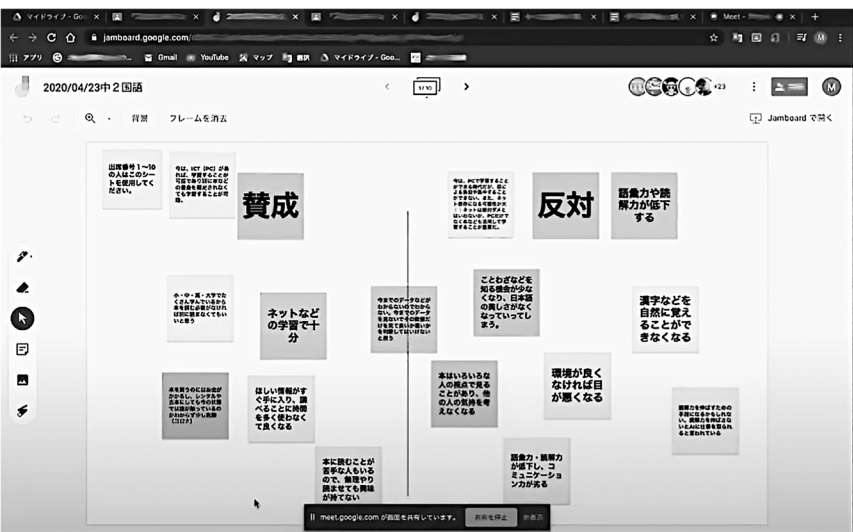
Google Jamboardを活用した授業例

オンライン授業の課題としては、生徒一人一人の顔色や表情、声などを観察しているが調子を全て把握できるわけではないことや、コミュニケーションにやりづらさを感じている教員もいることなどを指摘した。授業中に生徒の集中力を途切れさせない工夫も、対面の授業以上に必要だ。ICT機器などの操作について相談できる部署や人員の確保も重要としている。